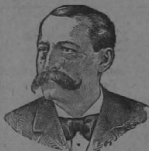
Marca de Fábrica registrada